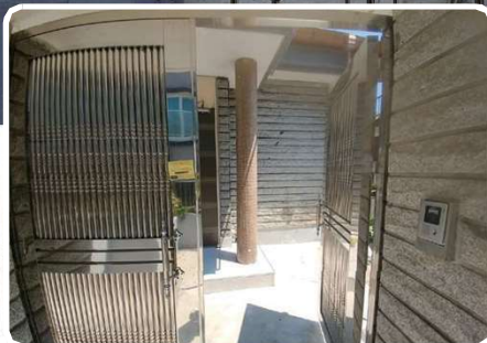
리모델링형 희망아지트 (내부 수리 후 활용)